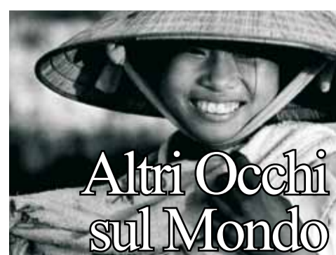
Altri Occhi sul Mondo