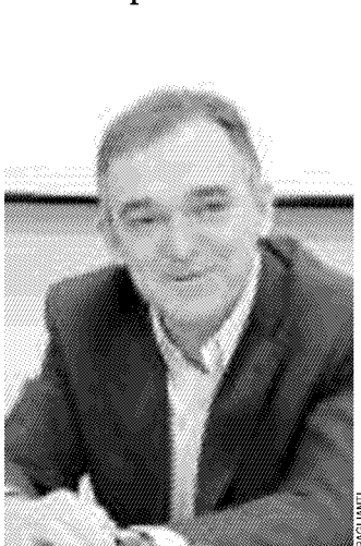
Il governatore della Toscana Enrico Rossi

Se la prende con amministrazioni pubbliche e comitati?