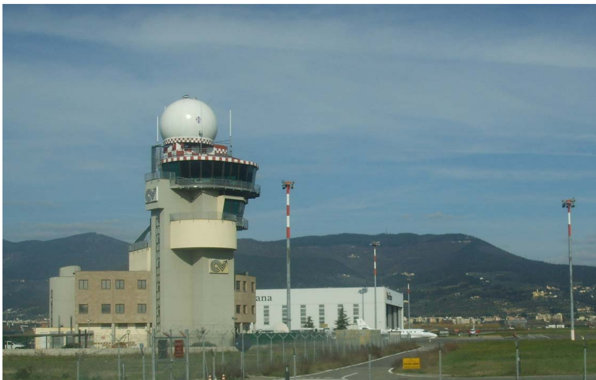
La torre di controllo dell'Aeroporto di Firenze

Soddisfazione per l'accordo viene espressa dal segretario della Fisac Cgil responsabile per Mps, Antonio Damiani , che sottolinea come il Monte dei Paschi, a differenza degli accordi siglati in altri gruppi, si è impegnato a fare le nuove assunzioni senza deroghe al contratto nazionale e integrativo.