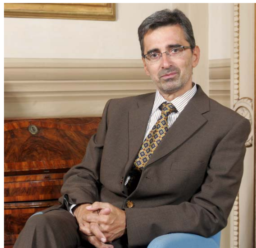
L'assessore Gianfranco Simoncini

Il 2011 per l'occupazione in Toscana inizia con qualche segnale di ripresa. La cassa integrazione a gennaio di quest'anno, dopo un 2010 che ha visto un aumento del 59%, ha registrato un aumento solo del 3,7%. Questo uno dei dati illustrati dall'assessore regionale alle Attività produttive, lavoro e formazione, Gianfranco Simoncini . L'assessore ha spiegato che mese dopo mese il