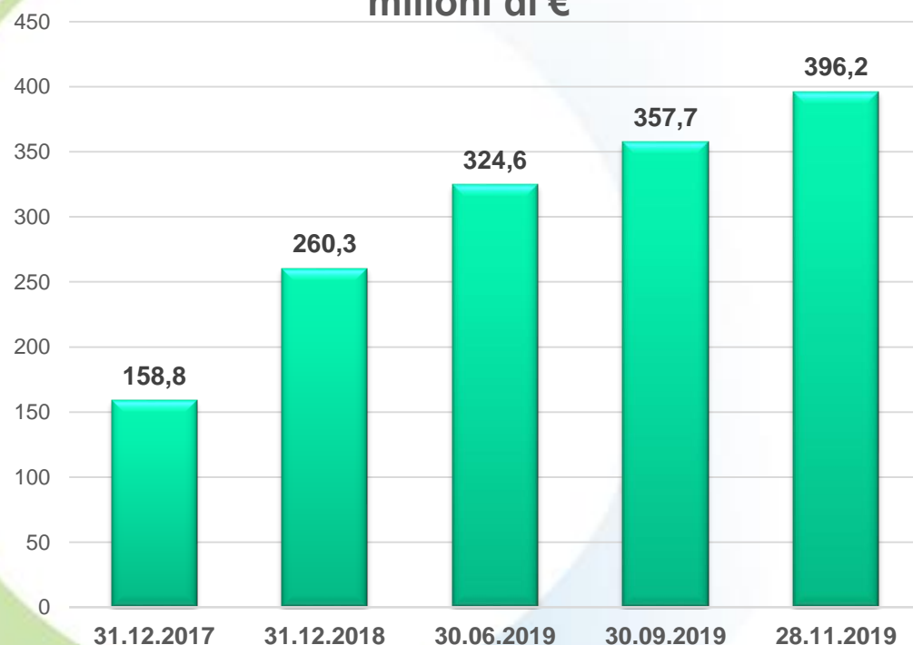
Andamento dei pagamenti (cumulati) in milioni di €