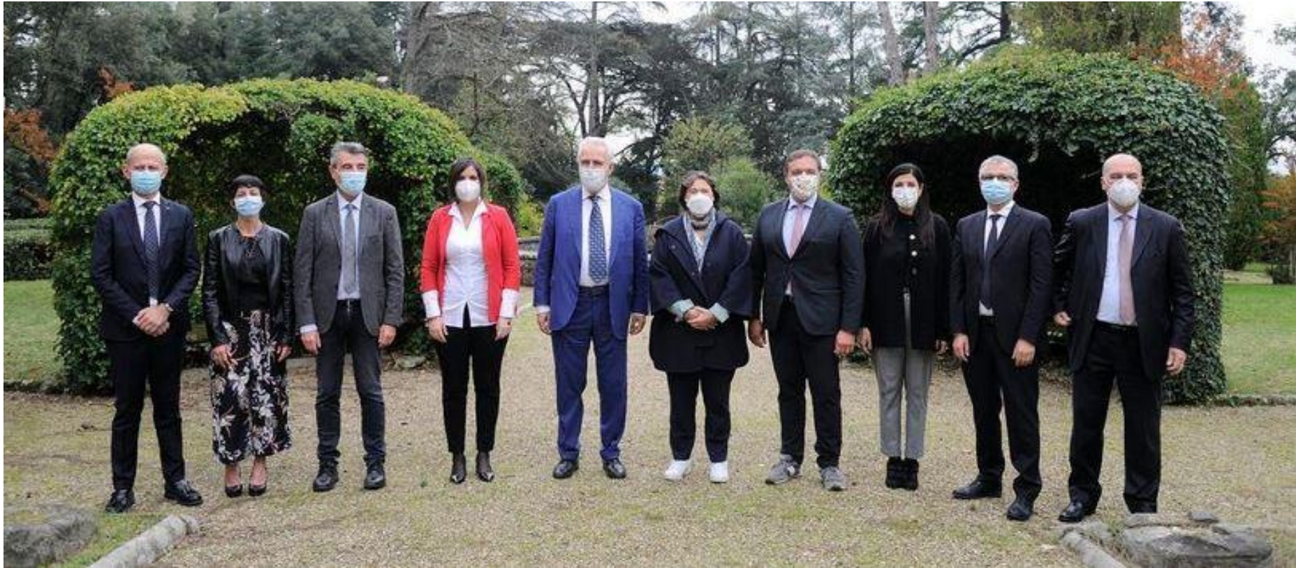
Istantanea della presentazione della Giunta regionale presso la Villa Medicea di Careggi