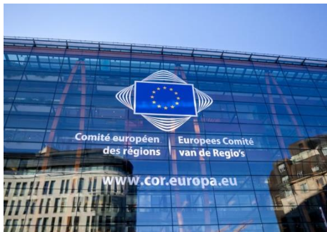
Comitato europeo delle Regioni

Mentre con le altre Istituzioni europee #ToscanaBXL ricopre un ruolo di collegamento, con il CdR lavora attivamente in una logica di pieno supporto istituzionale al suo membro titolare, sempre in una logica di servizio e tutela degli interessi toscani.