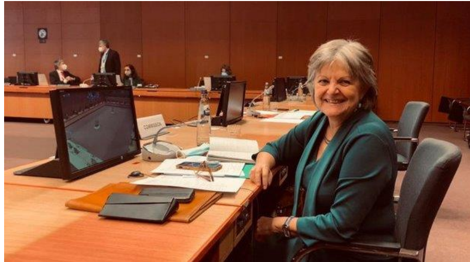
Commissaria europea per la coesione e le riforme Elisa Ferreira