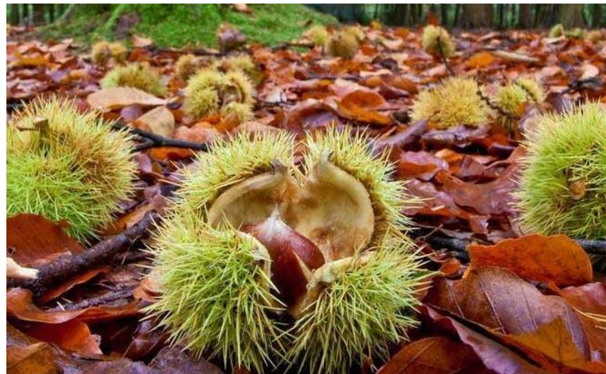
Castagneto - Monte Amiata