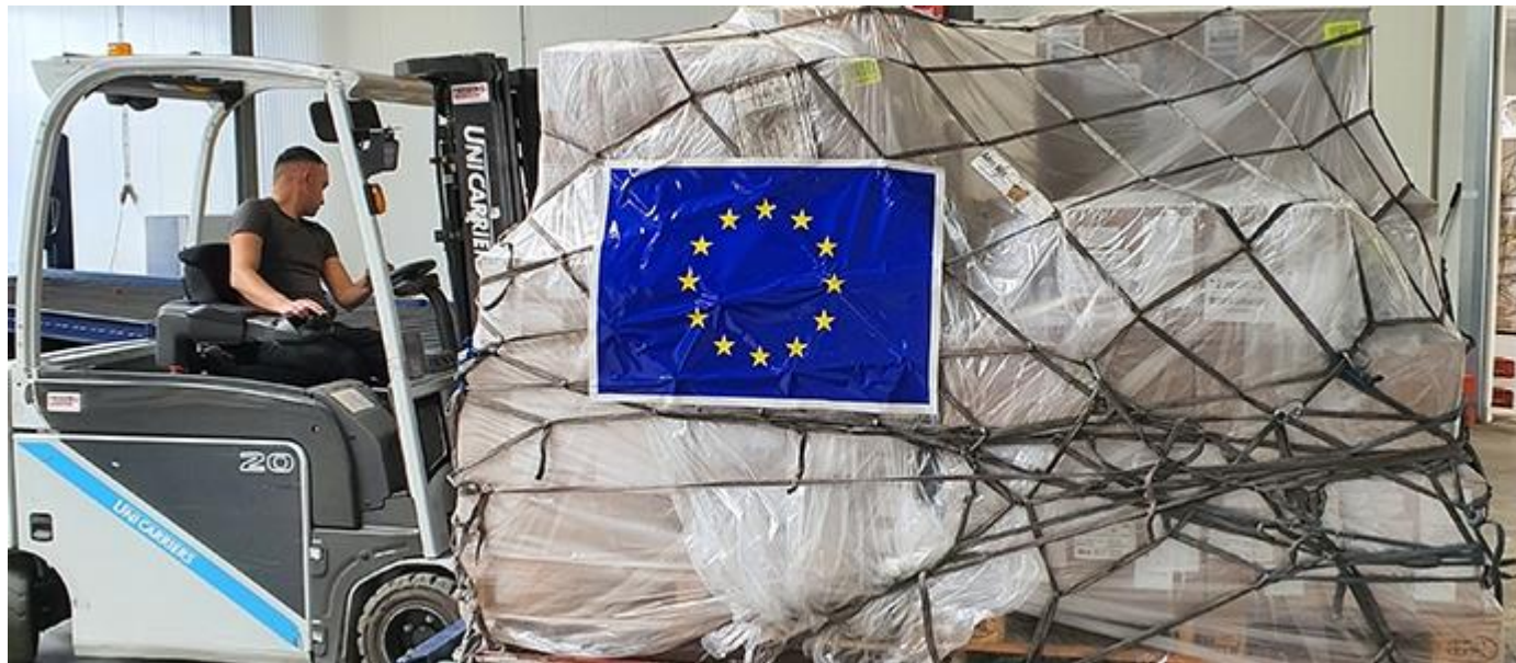
Istantanea aiuti RescuEU