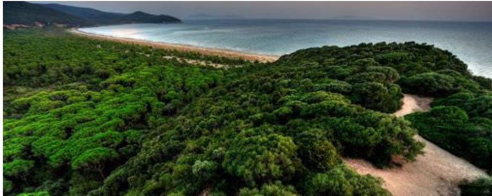
Istantanea Ente Terre Regionali Toscane