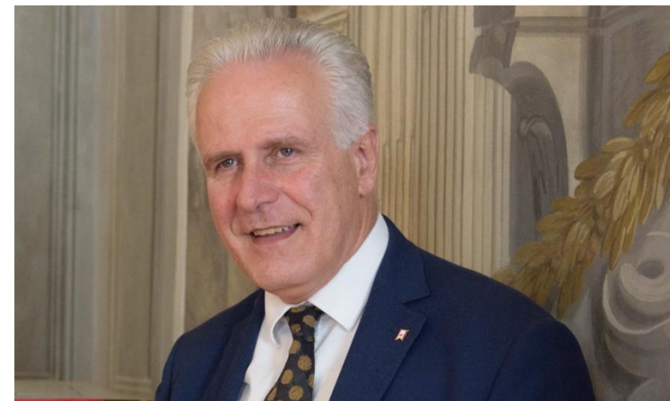
Eugenio Giani Presidente Regione Toscana e Vicepresidente della rete CRPM

La quasi totalità delle Regioni dell'area costiera europea fanno parte della CRPM . I suoi principali obiettivi sono il rafforzamento della coesione sociale, economica e territoriale, delle politiche marittime, e dell'accessibilità. Oltre ad essi la governance dell'UE, legata al principio della sussidiarietà, l'energia e i cambiamenti climatici, le politiche di vicinato e di sviluppo rappresentano altri campi d'azione.