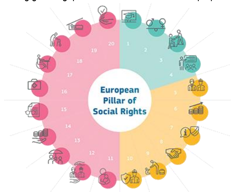
Pilastro europeo dei diritti sociali