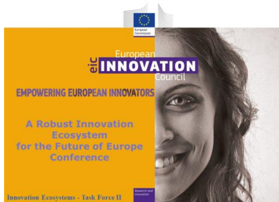
Locandina della conferenza