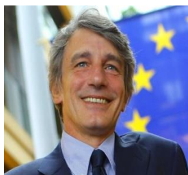
David Sassoli - S&D

Il Parlamento europeo è l'unica Istituzione dell'UE eletta direttamente dai cittadini europei, ad oggi non esiste una vera e propria "circoscrizione Toscana", perché la nostra Regione fa parte della più estesa circoscrizione elettorale dell'Italia centrale. Tuttavia, i deputati con un forte radicamento territoriale e con cui #ToscanaBXL è in contatto in una logica di servizio a favore degli interessi toscani e di pieno supporto istituzionale, sono: