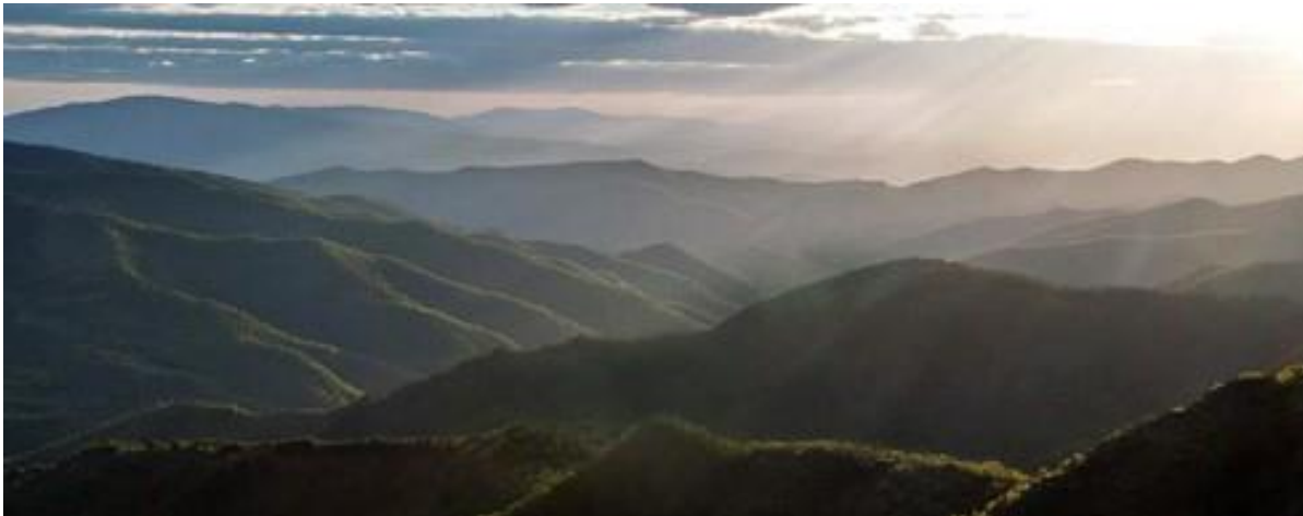
Foresta Modello Montagne Fiorentine

Il progetto ha visto una stretta sinergia tra Regione Toscana e attori del territorio, quali l'Associazione Foresta Modello delle Montagne Fiorentine e alcune aziende innovative regionali operanti nel settore.