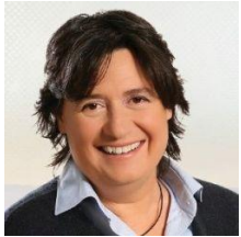
Stefania Saccardi Vicepresidente e Assessore all'Agroalimentare, caccia e pesca

Il settore agroalimentare e forestale gioca un ruolo di primo piano nelle politiche dell'UE, che nel tempo ha sviluppato molte iniziative settoriali. La Regione Toscana ha dedicato un'attenzione specifica a questo settore, quale elemento fortemente caratterizzante del suo territorio.