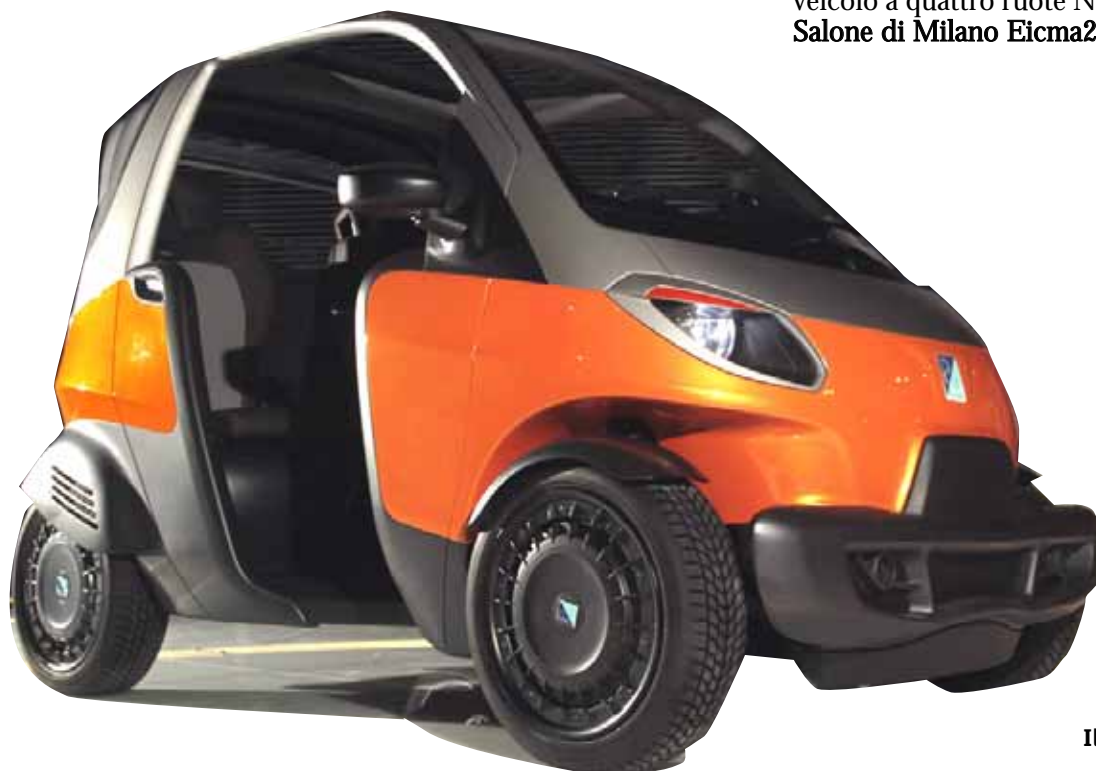
Il Piaggio Concept NT3