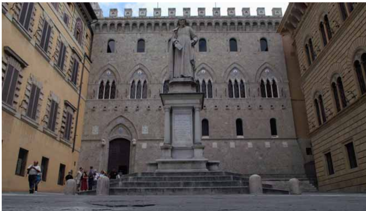
Siena - Piazza Salimbeni

Banca Mps , in seguito ad un'ulteriore definizione della compagine azionaria del Consorzio Perimetro Gestioni Proprietà Immobiliari , ha ceduto l'1,1% del proprio pacchetto azionario della società a Grapevine Re . La nuova compagine azionaria (azionisti di classe A) del Consorzio Perimetro, precisa Mps in una nota, sarà la seguente: Beni Stabili Gestioni SpA Sgr , 20,1%, Manutencoop Facility Management Spa , 20,1%, Siram Spa , 20,1%, Net Insurance Spa , 20%, Mediobanca Spa , 9,7%, Gruppo Montepaschi 7,9%, Grapevine Re Srl , 1,6 % (società indirettamente controllata da Fondazione Mps attraverso Sansedoni Spa ), Axa Assicurazioni , 0,5 per cento. Le compravendite sono state effettuate ad un valore sostanzialmente allineato al capitale sociale delle azioni di classe A pari a circa 5,5 milioni di euro. Il presidente del Consorzio Perimetro, espressione della Banca Monte dei Paschi di Siena, ha rassegnato le proprie dimissioni. Pertanto Banca Mps non esprime consiglieri in seno all'organo amministrativo del Consorzio Perimetro..