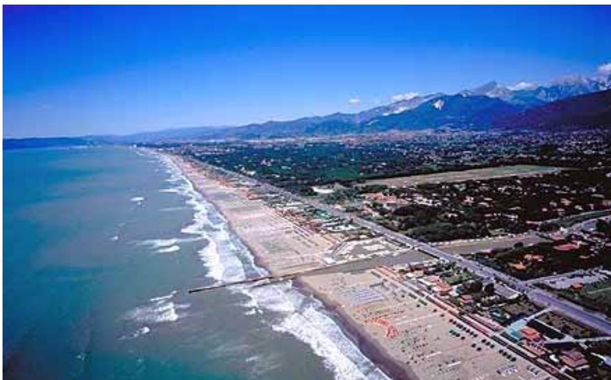
Il litorale di Marina di Carrara

Sono i dati diffusi dalla Cciaa di Firenze riguardanti l'interscambio commerciale della provincia fiorentina nel terzo trimestre 2010. Il saldo commerciale in valori assoluti è pari ad 1,9 miliardi di euro, rappresentando un valore peggiore rispetto a quello rilevato nel medesimo periodo del 2009 (2,2 miliardi di euro) in cui si era anche verificata una dinamica pesantemente negativa delle esportazioni (-16,6%). Il saldo commerciale normalizzato in termini relativi è pari a circa il 23% lievemente inferiore a quello del trimestre precedente (23,7%).