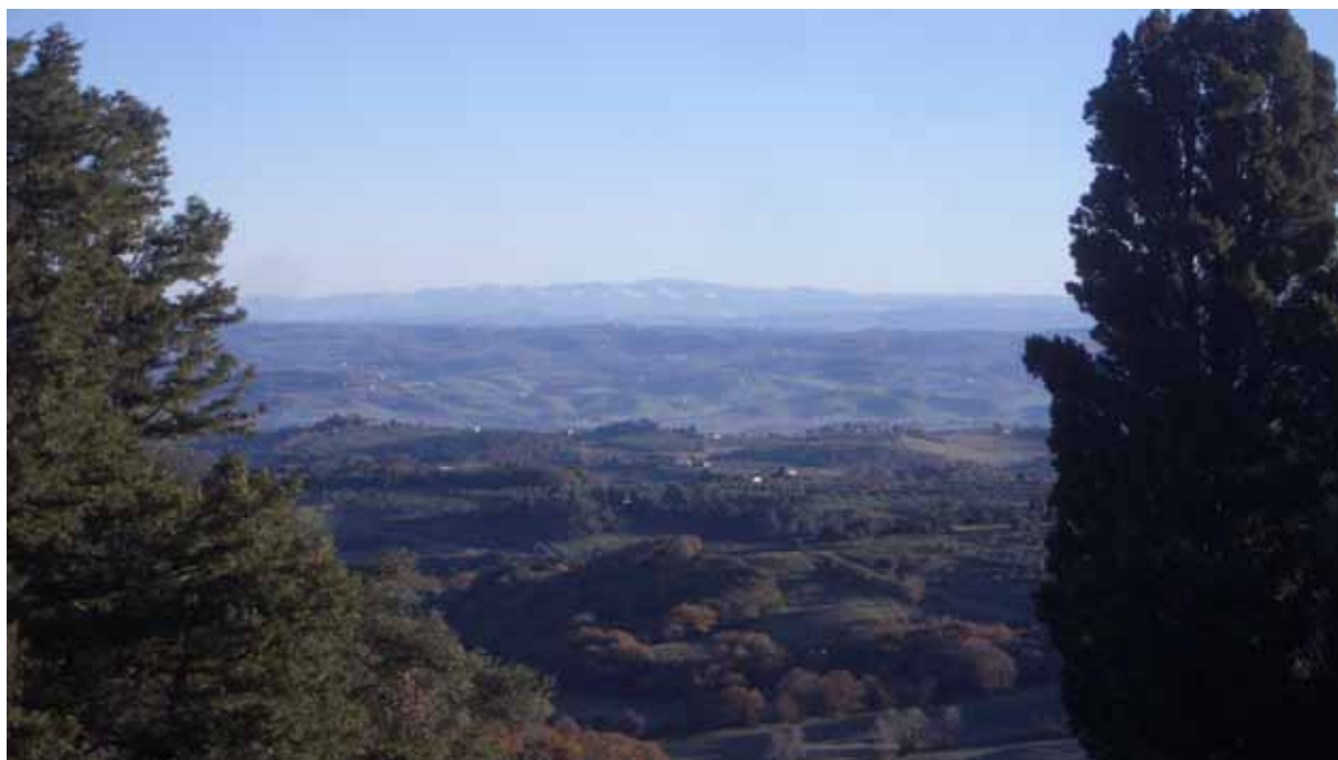
La Valdelsa tra Certaldo e Castelfiorentino

Realizzato dal Centro Sperimentale del Mobile (CSM) e dal Polo Universitario (PIN) dell' Università di Firenze , vuole analizzare il posizionamento strategico delle imprese coinvolte, suggerire le innovazioni che potranno essere attuate per migliorare il posizionamento competitivo delle imprese e fornire indicazioni per nuove opportunità di scelte strategiche verso nuovi prodotti e nuovi mercati. Il tutto in un'ottica territoriale che sviluppi l'innovazione della Val d'Elsa e delle sue imprese. Previsti interventi su sei specifici settori: camper, mobile e arredo, il settore della meccanica per le macchine della lavorazione del legno, meccanica per le macchine edili, vetro e cristallo, agroalimentare. Per ognuno dei settori è stato selezionato un gruppo di imprese rappresentativo, attraverso il quale i ricercatori definiranno il posizionamento competitivo nell'ottica di un'analisi complessiva del sistema produttivo della val d'Elsa.